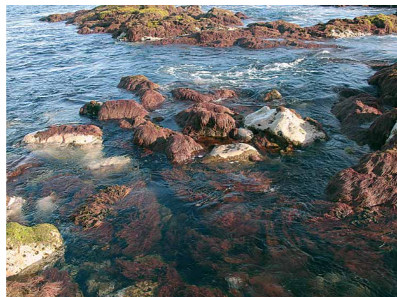
Fig. 1: Asparagopsis armata na costa de São Miguel

Quanto à caracterização dos vários extratos obtidos a partir de alga fresca, o uso de diferentes solventes polares (água, etanol e misturas destes), ou diferentes métodos de extração (maceração a quente ou frio, extração com ultrassons ou com micro-ondas) não evidência diferenças significativas na quantidade de compostos extraídos (cerca de 1,3 a 2,0 %), embora se tivermos em conta fatores relativos a economia de tempo e de energia o método de extração por ultrassons