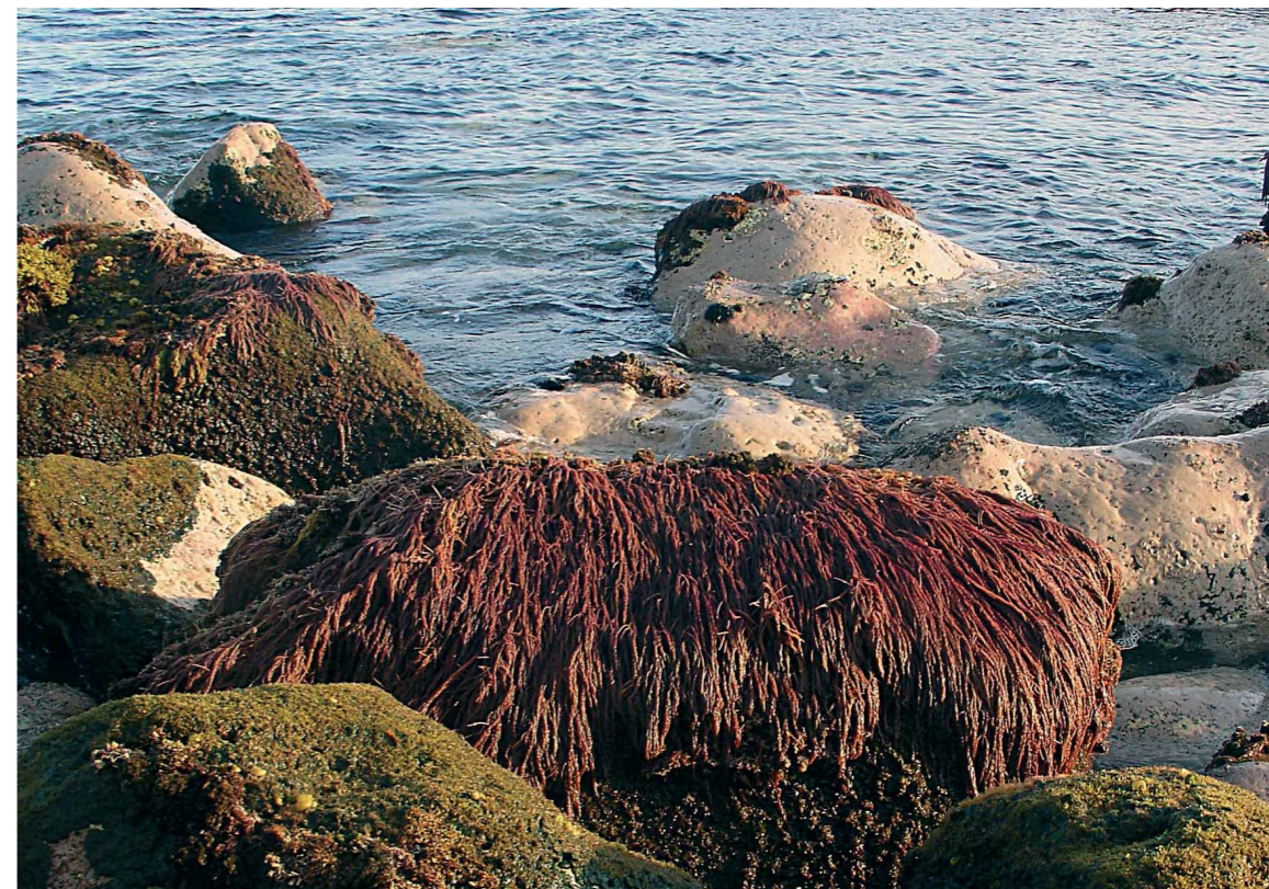
Figura 2. Presença de Asparagopsis armata no litoral da ilha de São Miguel.

alga invasora na estrutura e funcionamento das comunidades litorais. Pretende-se ainda: (iv) entender a influência das alterações climáticas na dinâmica desta espécie e na sua distribuição no arquipélago; (v) desenvolver formas de utilizar e rentabilizar o seu uso na área da biotecnologia marinha; e (vi) propor as melhores práticas para a exploração desta alga nos Açores.