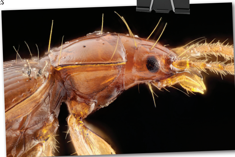
FOTO 1. Macro extrema de um exemplar vivo de Trechus terceiranus capturado no Algar do Carvão - detalhe da parte anterior do corpo (cabeça e tórax).